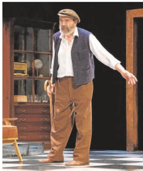
Miguel Rellán, en una escena de 'Retorno al hogar'