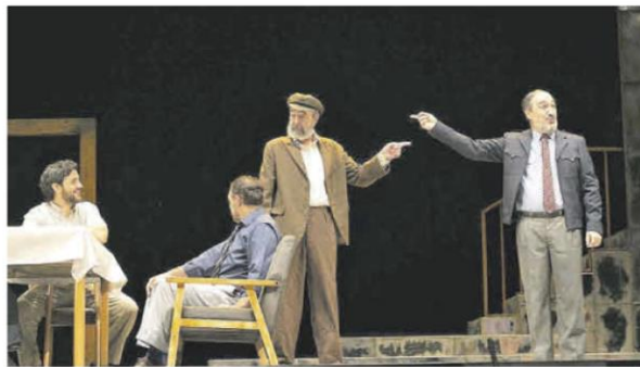
Un momento de la representación de «Retorno al hogar», cuyo estreno nacional acogió anoche el teatro Palacio Valdés.