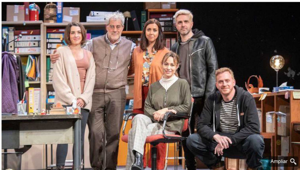
Equipo de 'Tercer Cuerpo'