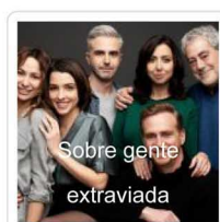
Sobre gente extraviada