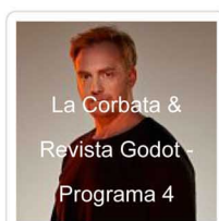
La Corbata & Revista Godot - Programa 4