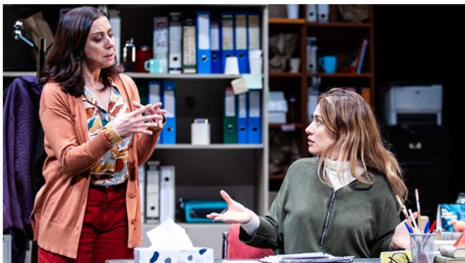
Carmen Ruiz y Natalia Verbeke, en una escena de 'Tercer cuerpo' - E. C. Graiño