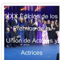
XXX Edición de los Premios de la Unión de Actores y Actrices

Echando un vistazo a tu carrera vemos que no temes lanzarte a un cabaret, al teatro del absurdo o al clásico, ¿en la variedad está el crecimiento del intérprete?