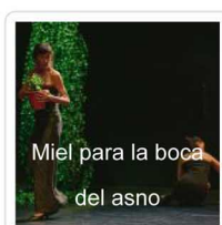
Miel para la boca del asno