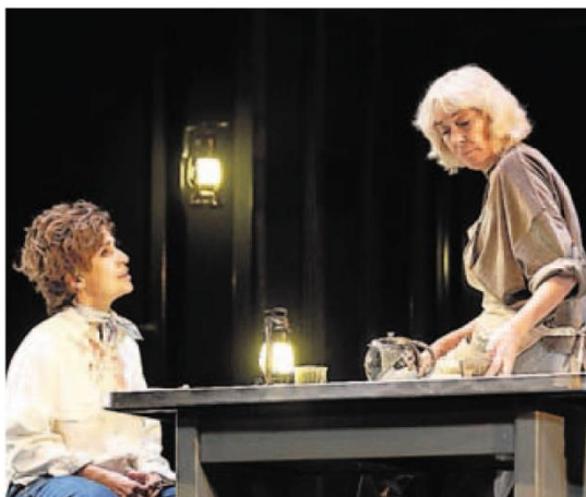
Adriana Ozores y Susi Sánchez, en "Los hijos".