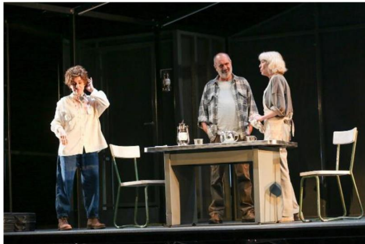
Adriana Ozores, Joaquín Climent y Susi Sánchez, sobre las tablas del Teatro Valdés.

David Serrano estrena con éxito su nuevo montaje, con Adriana Ozores, Joaquín Climent y Susi Sánchez