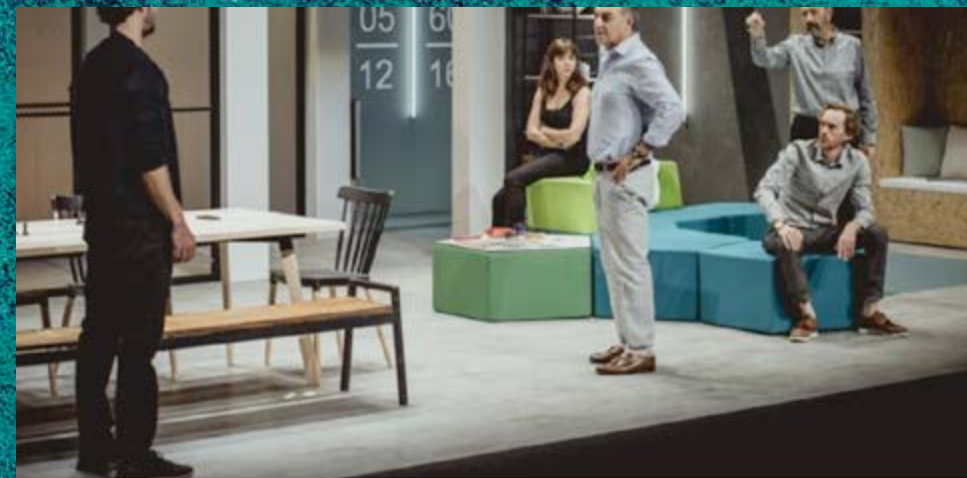
Una escena de «7 años» - Nacho Gual

https://www.abc.es/cultura/teatros/abci-7-anos-hacer-facil-dificil-201810240208_noticia_amp.html